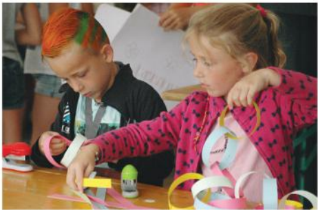
Jawel hoor, ook vanochtend gingen de voorbereidingen voor het versieren gewoon weer van start!