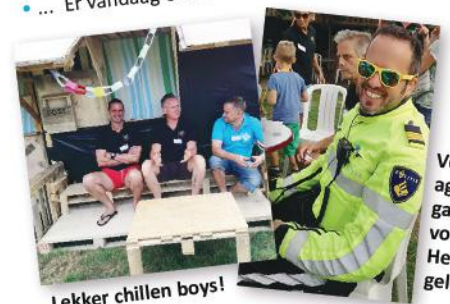
Lekker chillen boys!

Volgens agent Meijer gaat alles volgens de Hei2o-regels, gelukkig maar!