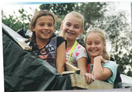
Wat denk je, zal deze hut waterdicht zijn?

Uitspraak van de dag: "Brrt... wat is dat water nat! ....ow euh...., ik bedoel kkkoud!"