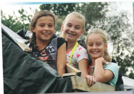
Wat denk je, zal deze hut waterdicht zijn?

Uitspraak van de dag: "Brrt... wat is dat water nat! ....ow euh...., ik bedoel kkkoud!"